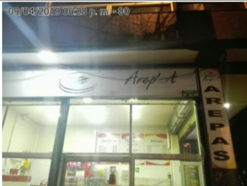
Fotografía panorámica del establecimiento de comercio AREP ART, donde se evidencia los incumplimientos anteriormente descritos.