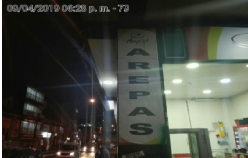
Fotografía panorámica del establecimiento de comercio AREP ART, donde se evidencia los incumplimientos anteriormente descritos.